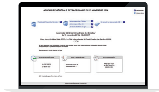
Vote en quelques clics